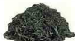
Tontes de Gazon