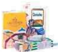
Boîtes en Carton