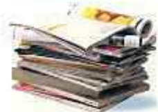
Magazines - Journaux Prospectus