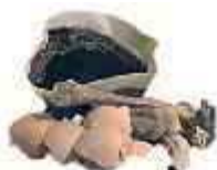
Déchets de Table